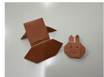
左:言葉のみ 右:図あり

感覚の違いを実感するとともに相手の立場に立って考える機会を中学生に提供されていることがわかりました。