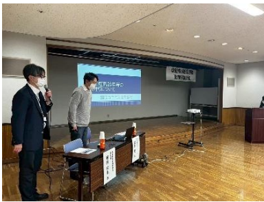
高齢者総合福祉施設 桐生園 特別養護老人ホーム アシタバ