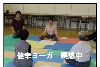
健幸ヨーガ 瞑想中