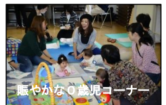
賑やかな0歳児コーナー