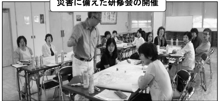
災害に備えた研修会の開催

私たち民生・児童委員は常にもろいろな研修会に参加し、必要な知識を得る努力をしております。