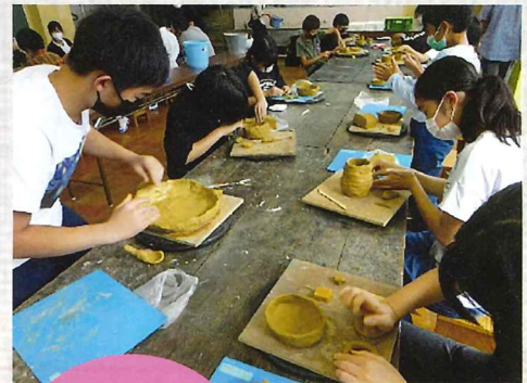
焼き物づくりを楽しむ 6年児童たち

地域のプロの芸術家に来ていただいて、特別授業をしていただきました。「芸術の秋」実りある時間になりました。ありがとうございました!