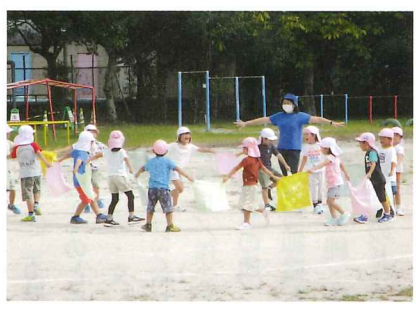
運動会に向けて友達と力と気持ちを合わせて、パラバルーンで楽しみました。(4歳児)

※県下で感染症が流行している時や『まん延防止措置』『緊急事態宣言』が発令された場合は、事業を中止します。『やまのこひろば』または『コミュニティセンター』にお問い合わせください。 ~『やまのこひろば』の事業内容~ <園庭開放>月~金曜日 AM9:30~11:30 対象は未就園親子(降園後の在園児のみ 14:00~17:00) <どんぐりころころ>(幼稚園未就園親子通園事業)おひさまルーム及び園庭で過ごします。 <にこにこキッズ>自治会館 こまれび <ほのぼの会>やまのこひろば おひさまルーム 077-529-2700保育園・077-529-2060幼稚園