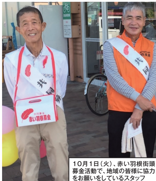
10月1日(火)、赤い羽根街頭募金活動で、地域の皆さんに協力をお願いしているスタッフ

赤い羽根共同募金は昭和22年に「国民助け合い運動」として始まり、現在まで多くの方に支えられ73年目を迎えました。時代の流れと共に、社会経済状況や、人々の生活意識が変化していく中、共同募金は地域社会の福祉を推進するために「たすけあい」、「おもいやり」の心を大切にしながら運動が行われてきました。大津市共同募金も、「誰もが住み慣れた地域で安心して生活できるまちに」との元、「地域で助けを必要としている方のために」住民相互による助け合い活動の普及に努めてきました。昨年度は大津市全域で4千万円近くの寄附をいただき、その内88%が地元へ還元され、高齢者に対する支援、ふれあい給食事業、ふれあいサロン事業等さまざまな福祉事業に活用されています。12%は災害等に対する準備金や県内の広域的な福祉課題の解決に活用されています。10月1日(火)に瀬田南社協のスタッフはフレンドマート、フレスコの店先で地域の皆さんに街頭募金の協力をお願いしました。