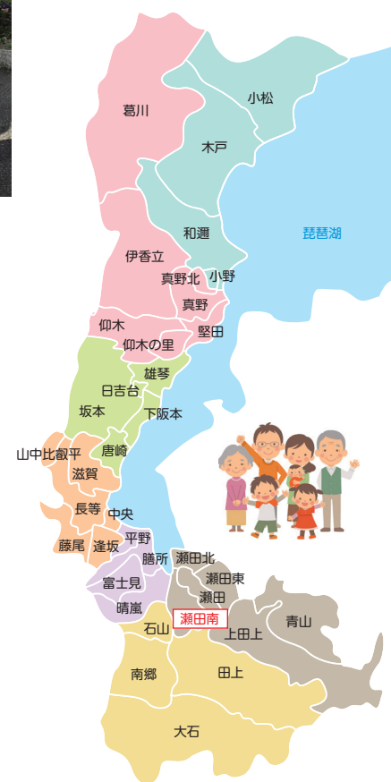
大津市の36学区社協