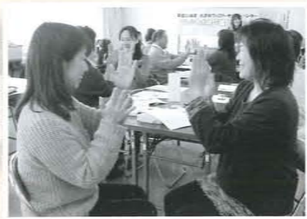
ファミサポ交流会