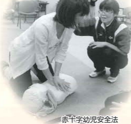
赤十字幼児安全法